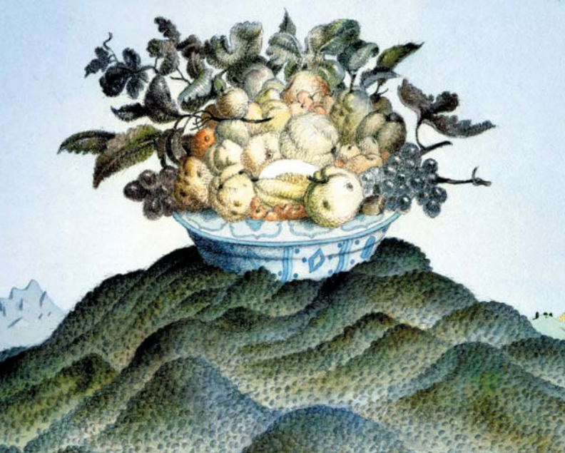
Tullio Pericoli, "Frutti di Bosco", 1992